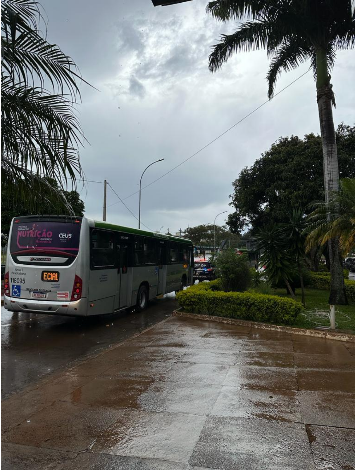
Figura 6. Ônibus com pessoas detidas