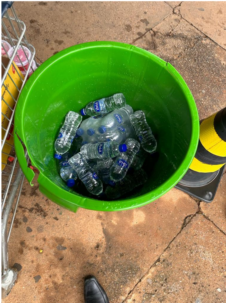
Figura 1. Garrafas de águas para as pessoas detidas