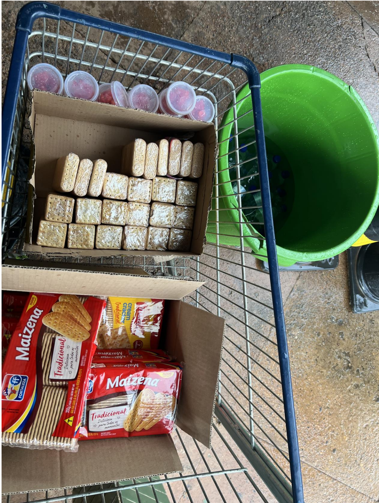
Figura 7. Alimentação destinada para as pessoas detidas