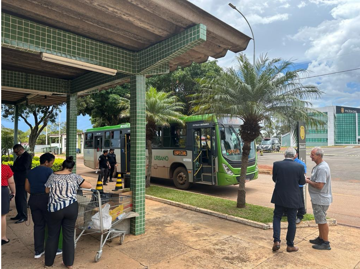
Figura 2. Ônibus comum com as pessoas detidas