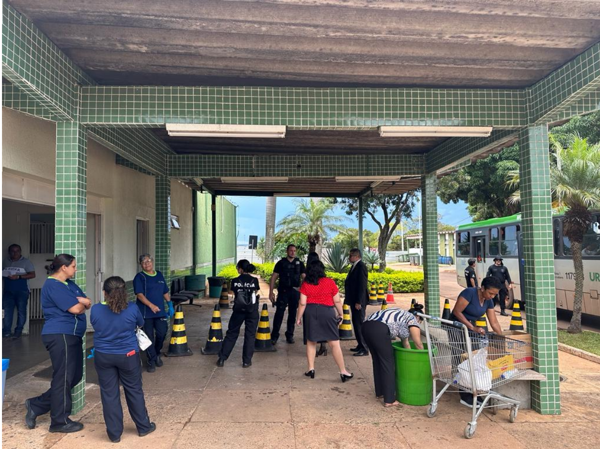
Figura 3. Servidores e membros da OAB/DF