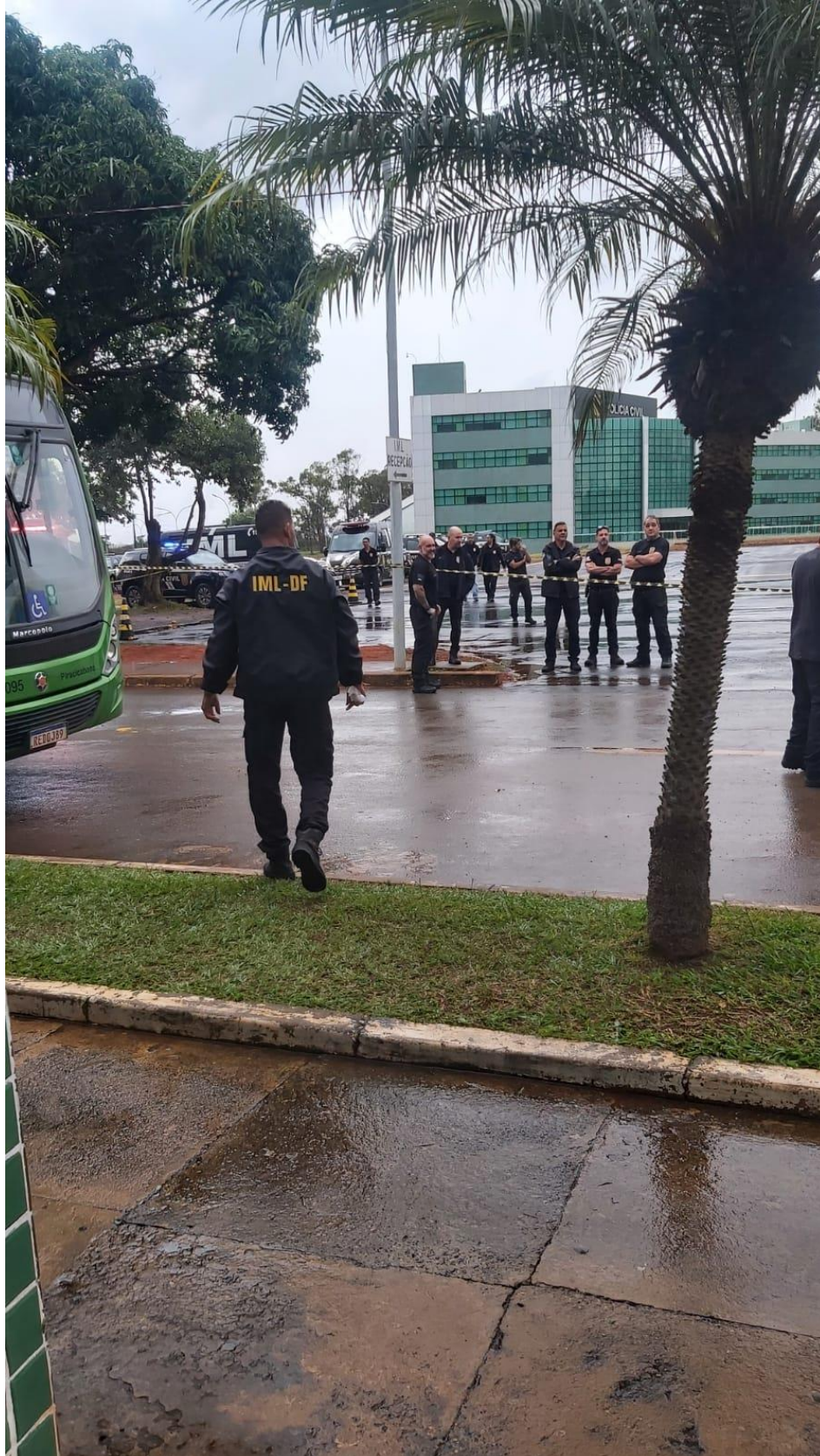
Figura 8. Servidores