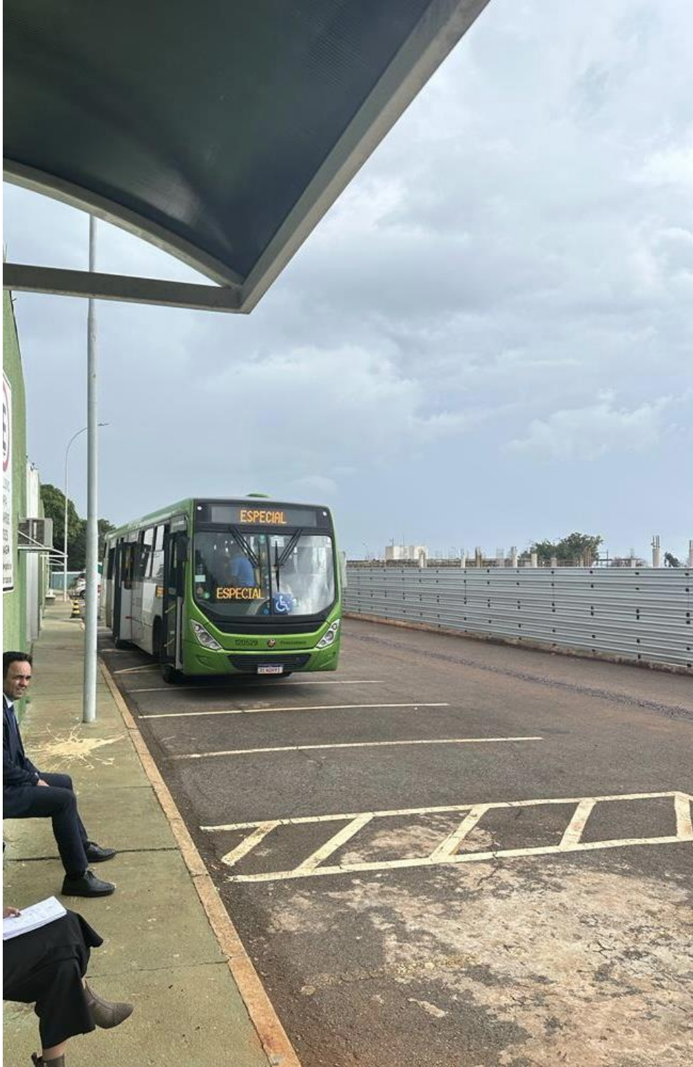
Figura 4. Ônibus comum com pessoas detidas