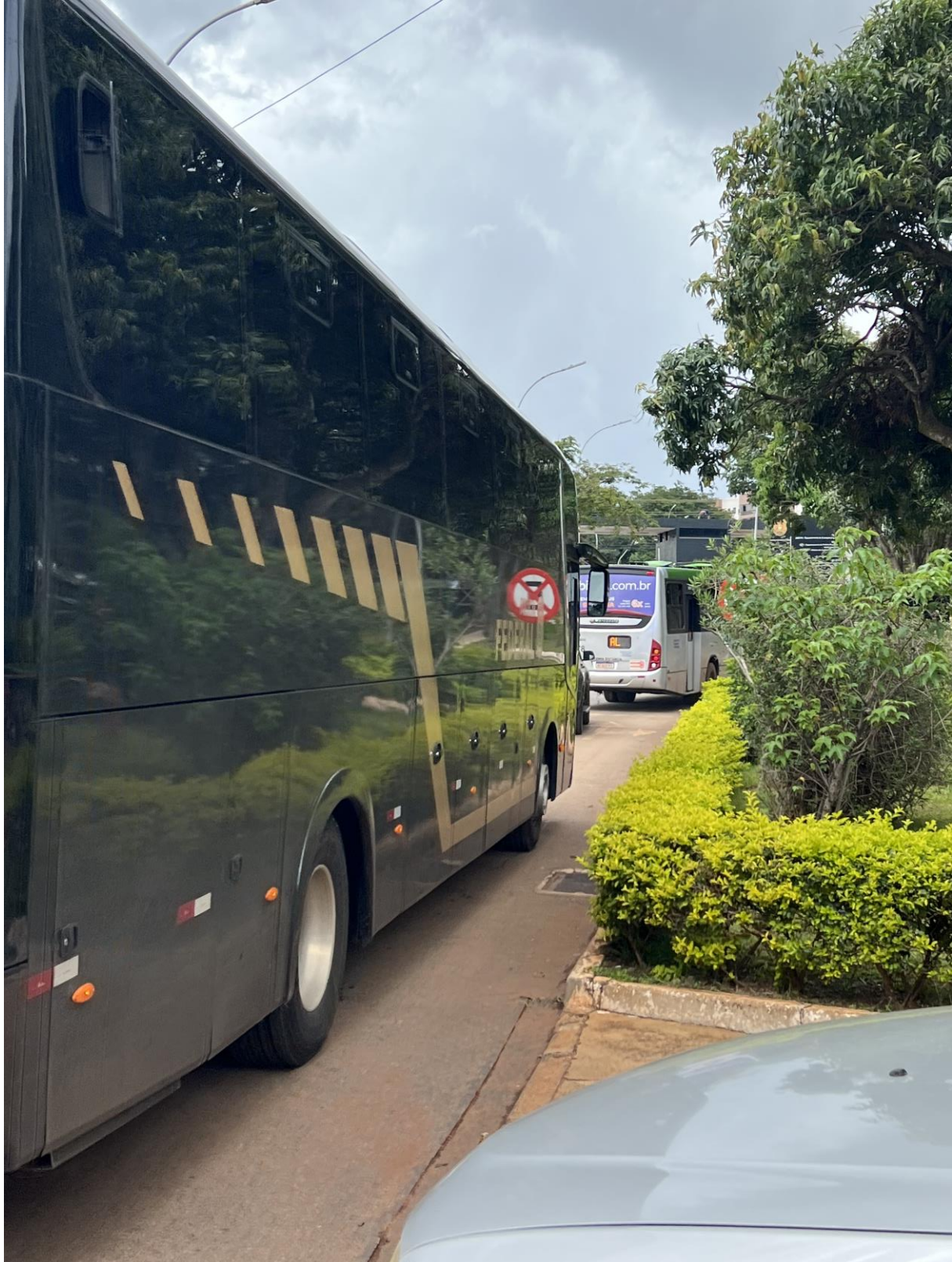
Figura 9. Ônibus cedido pela Polícia Federal