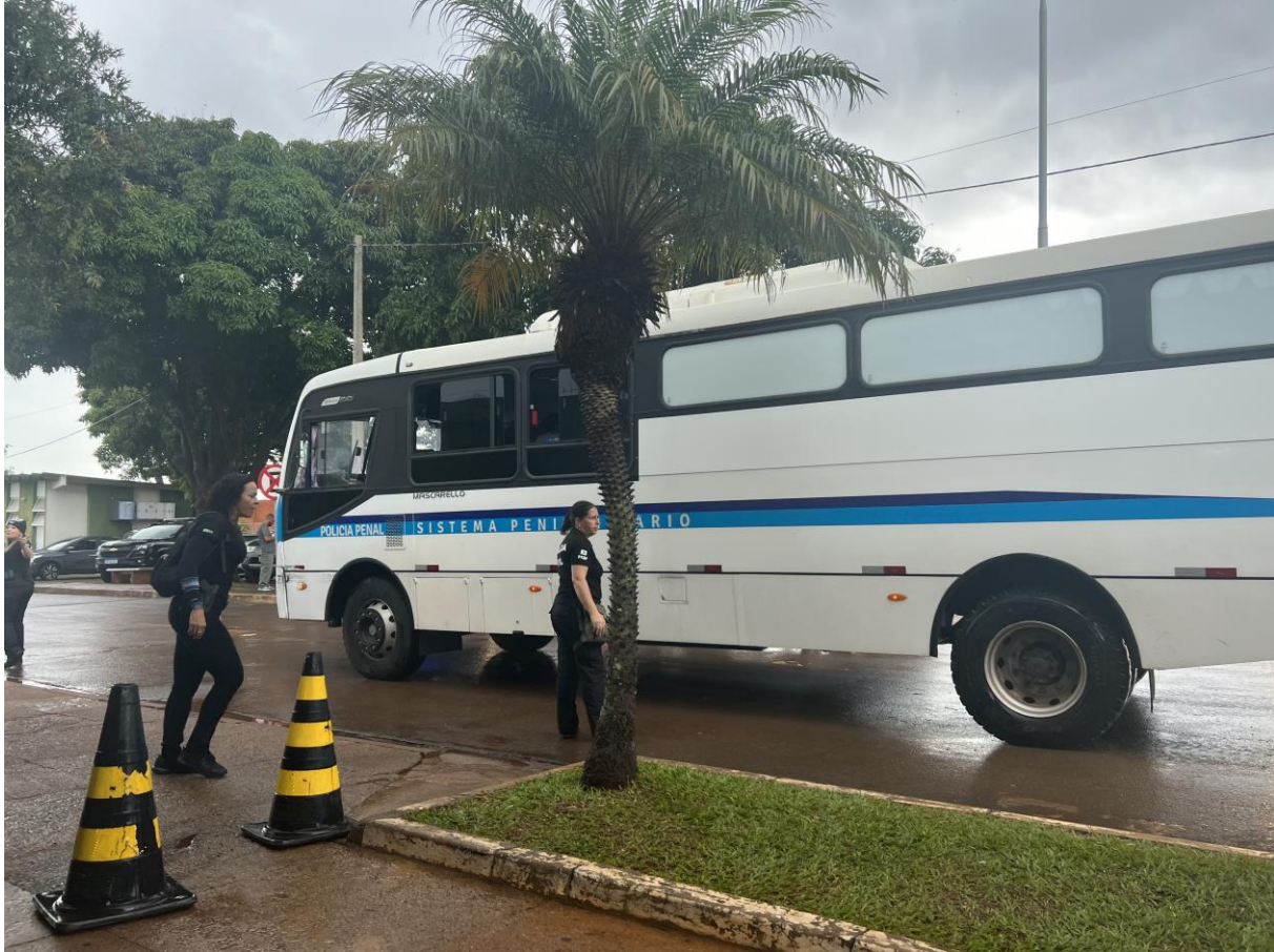
Figura 5. Ônibus cedido pelo sistema penitenciário