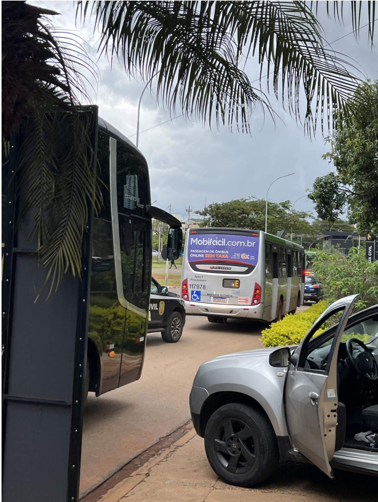
Figura 10. Ônibus comum com pessoas detidas